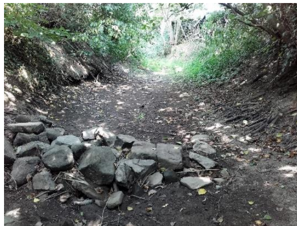
La Scheer à sec en plaine d'Alsace

Pareille situation a déjà été connue en 2018 et 2019 avec une amplification du phénomène cet été.