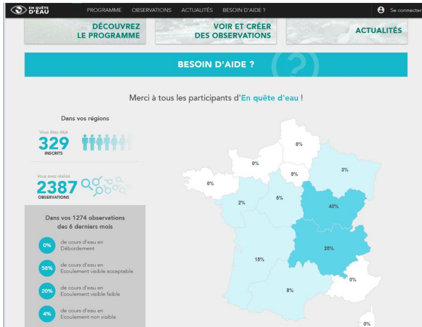
Carte interactive depuis https://enquetedeau.eaufrance.fr/

Le Syndicat Mixte Ehn-Andlau-Scheer vous encourage à vous identifier sur le site https://enquetedeau.eaufrance.fr/ et ajouter vos observations locales.